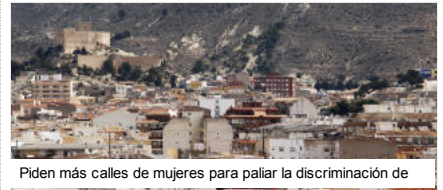
Piden más calles de mujeres para paliar la discriminación de